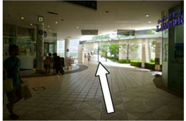
2. ナチュラルローソンを右手に矢印の方向に進みます。