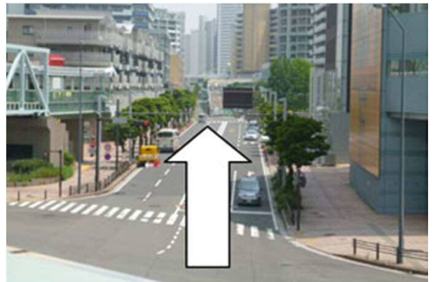
4. 大通りを矢印の方向に進みます。