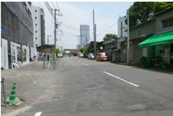
5. 5分程まっすぐ進むと、突き当たり右側の線路渡ります。