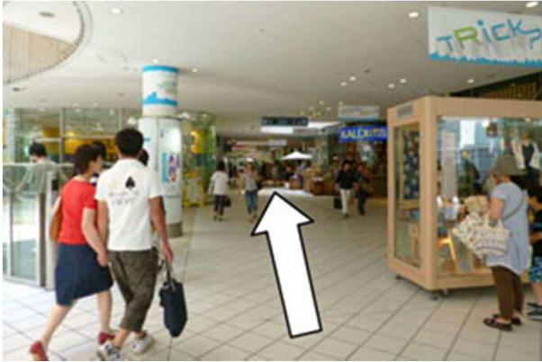
1. バイクオーターから矢印の方向に進みます。