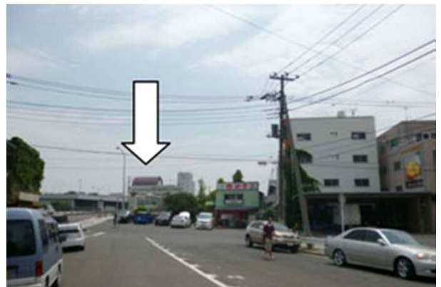
6. 線路を渡ると緑の屋根の建物が見えてきます。 (写真では赤色の屋根の建物)