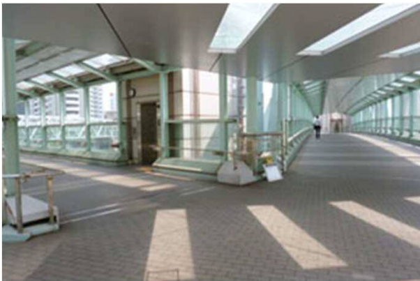
3. 左右いずれかに進み、陸橋を降ります。