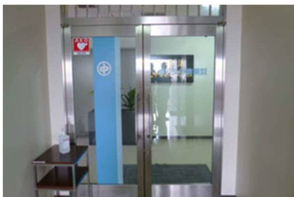
7. エレベーターを降りて右手に弊社入口があります。