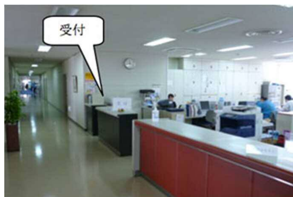
8. 奥側の受付でご用件をお申し付けください。