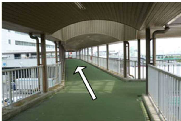
5. 白い建物に向かって通路を進む。